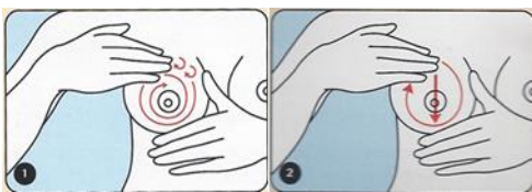
Massage du sein