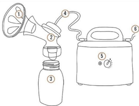
Schéma tire-lait électrique