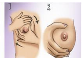
Compression du sein pendant le tirage